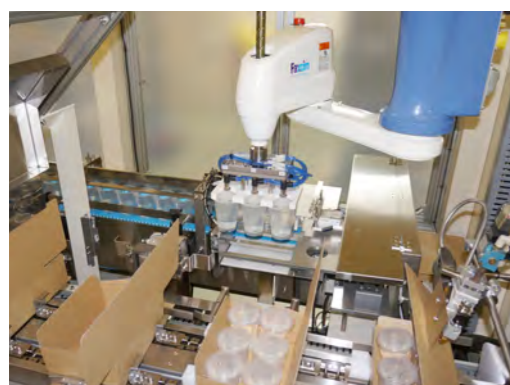
■自動集積ロボットシステム